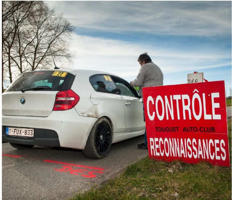
Les concurrents ont passé en revue le moindre détail des routes qu'ils emprunteront ce week-end pour le Rallye du Touquet.

l'aveugle. Quand une voiture de course arrive à très grande vitesse à un sommet de côte, il est préférable de savoir si la route va ensuite vers la droite ou la gauche... Sans ce travail, il serait impossible d'effectuer des passages en course aussi rapides, sauf à sortir de la route. En championnat du monde WRC, les règles sont encore plus strictes. Deux passages seulement sont autorisés. La vitesse est, elle aussi, totalement contrôlée par GPS, comme au Touquet cette année. ■